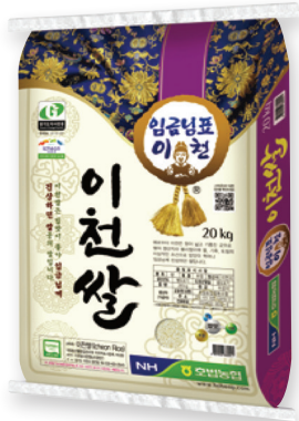
이천 임금님표 이천쌀