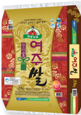
여주 대왕님표 여주쌀